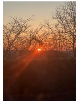
Lever du Soleil à Famars